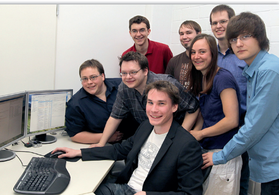
Abb. 1: IServ - Ein junges dynamisches Team

Die Anforderungen an eine Serverlösung für Schulen sind komplex. Eine große, häufig wechselnde Benutzergruppe mit entsprechenden Anforderungen braucht eine intuitiv bedienbare Arbeitsumgebung. Eine ehemalige Schülerfirma löst diese Aufgabe seit 10 Jahren mit ihrer Serversoftware IServ, die den Anspruch erhebt, so zuverlässig und einfach bedienbar zu sein, wie das Vorbild mit dem Apfel.